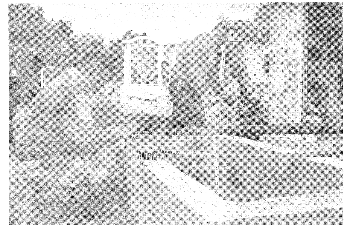
Elementos de Protección Civil acordonaron las áreas de riesgo.

En el operativo en los panteones, la Secretaría de Seguridad Pública participó con elementos policíacos colocados en los alrededores de estas instalaciones para garantizar la seguridad de los visitantes, mientras efectivos de tránsito apoyaron agilizando el tráfico de vehículos en avenidas cercanas a los camposantos. Por su parte, Protección