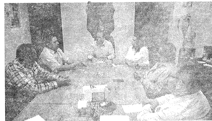
Se han tenido reuniones con el Director de Transporte en el Estado y dueños de las rutas de transporte.